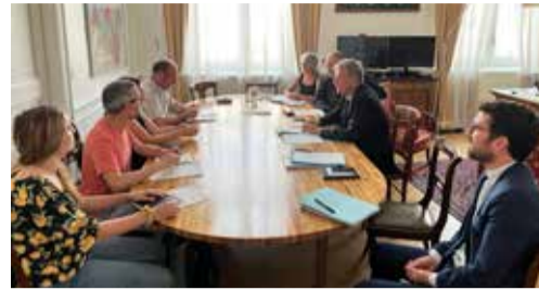
Les représentants d'Alda réunis avec le Préfet et ses services