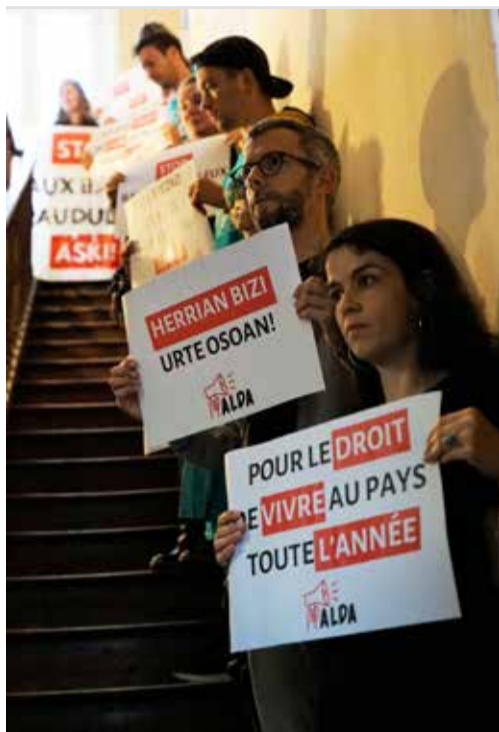
Les militants Alda accueillent un huissier